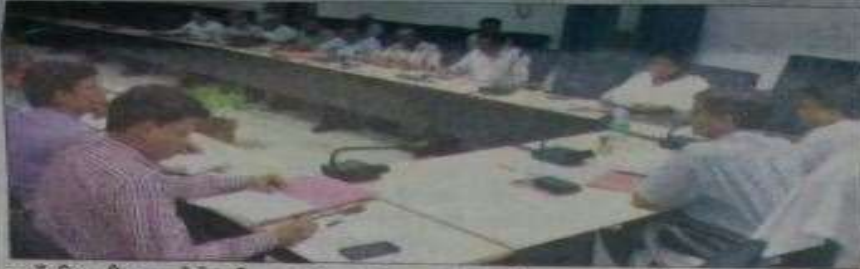
झांसी : बैठक लेते डीएम व उपस्थित अधिकारी।