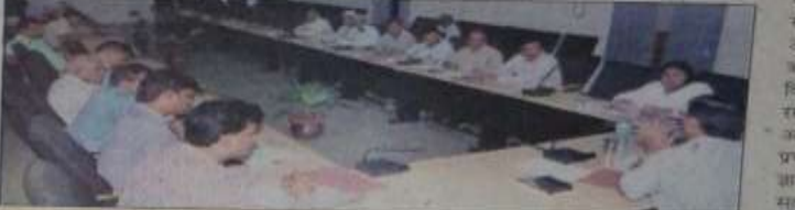
प्रार्थी। बैठक लेते जिलाधिकारी व मौजूद अधिकारीगण।